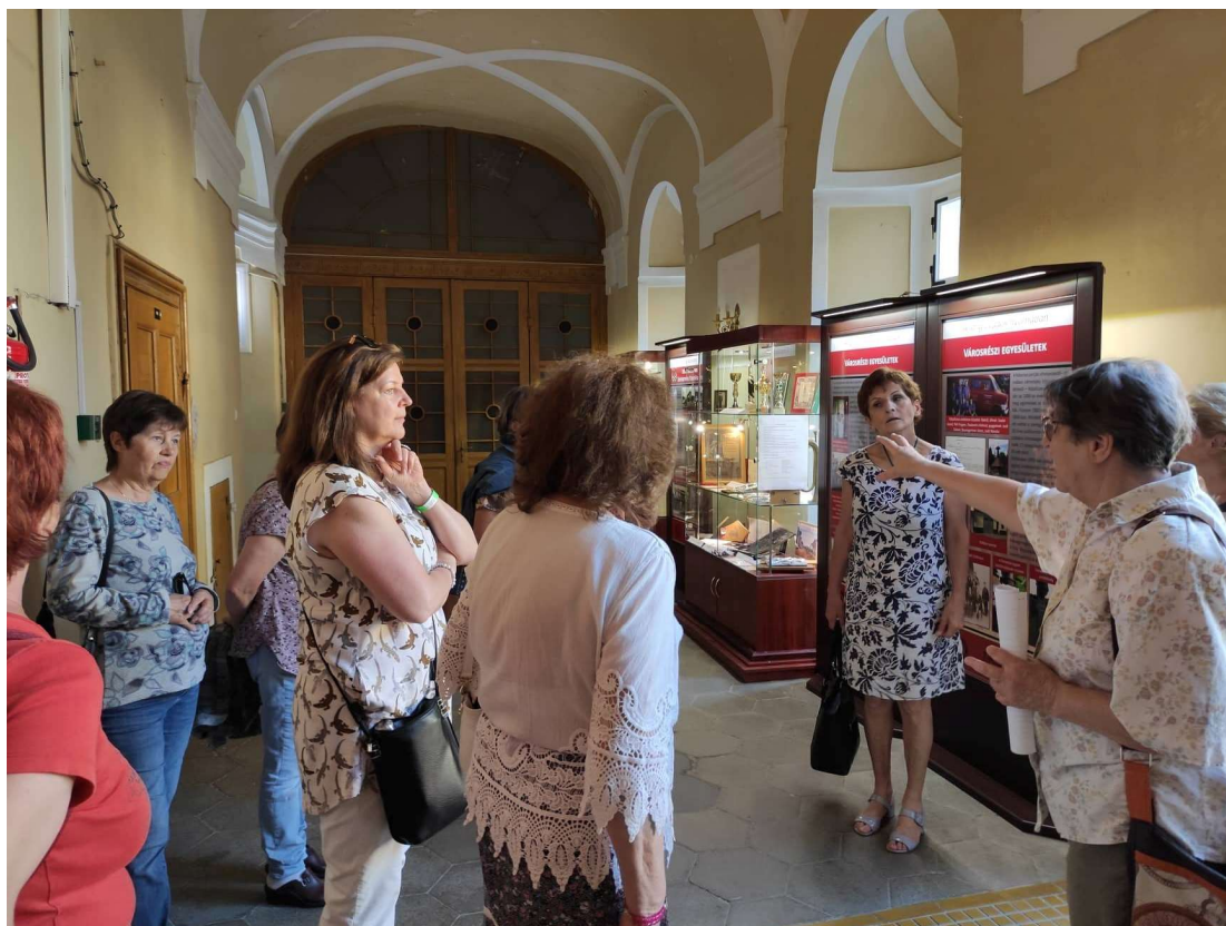
3. ábra: Túravezetés Szentgotthárdon