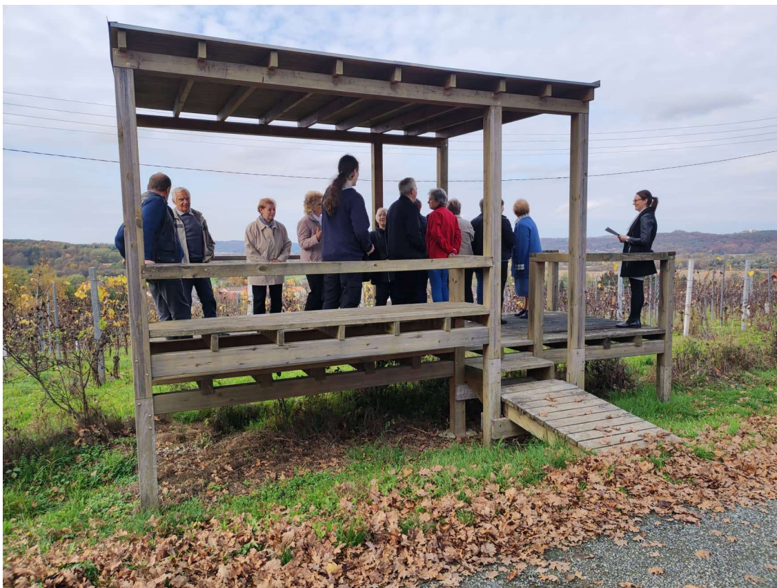
2. ábra: A „Rábavidéki szellemjárás” című mese és túraútvonal egyik helyszíne