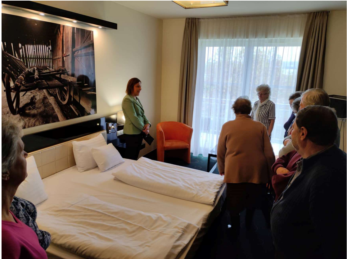
4. ábra: A vendéglátás alapjainak megismerése a Gotthard Therme Hotel & Conference-ben