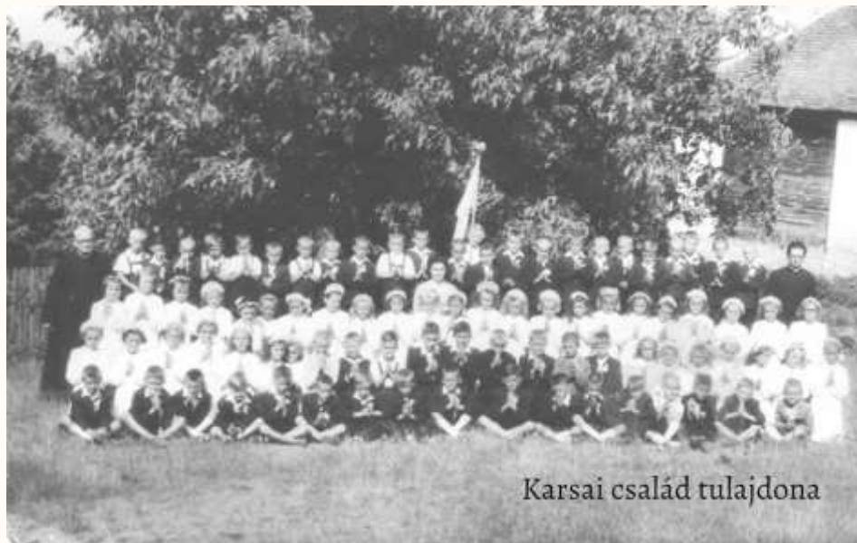
2. kép: Zsidai, magyarlaki és kethelyi elsőáldozó gyerekek. 1957 május.

Nem olyan pap volt, hogy jönnek a gyerekek, na most imádkozzunk – annak is megvolt a helye - ő játszott velük, futballoztak. A plébániának volt egy alsó- és felső udvara, ott futballozott a fiúkkal, amikor jöttek. Jöttek néha lányok is, hogy játszunk.