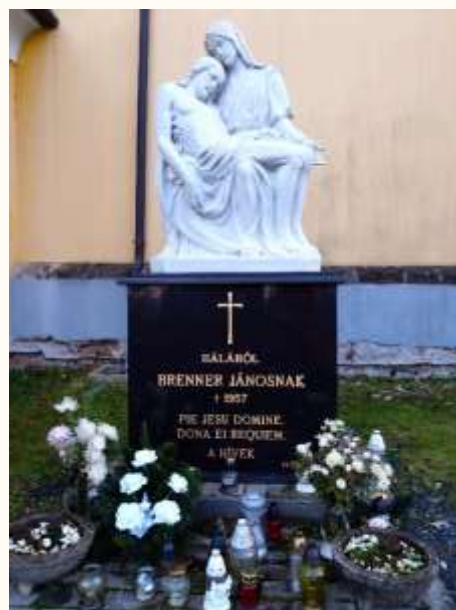
1. ábra Pietá a rábakethelyi temetőben